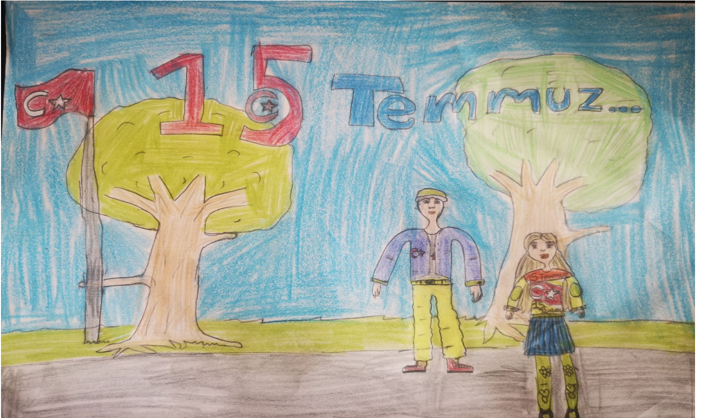
7/A SELVİNUR KAPLAN