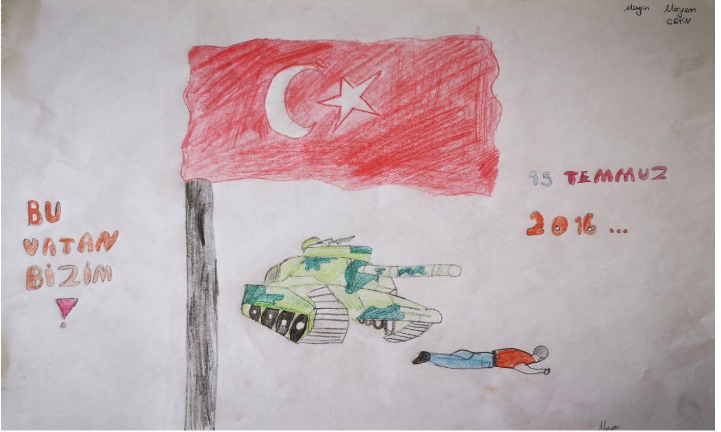
7/A MİZGİN MERYEM ÇETİN